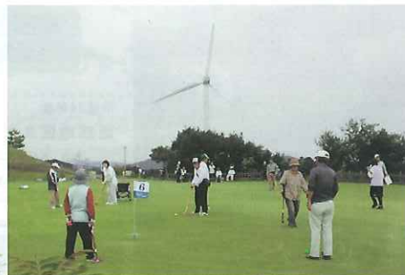
グラウンド・ゴルフ大会