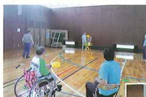
東部スポーツ教室の様子 (ディスクゴルフ)

火曜日 13:00～14:00 鳥取県営米子屋内プール(米子市皆生温泉)にて (平成24年度実績)