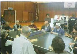
東部教室の様子 （卓球バレー）

身体は3地区でニュースポーツ（ペタンク・卓球バレー）の体験教室、知的は4校交流会、精神はソフトバレーボールの交流会を実施しました。