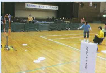
フライングディスク・アキュラシー