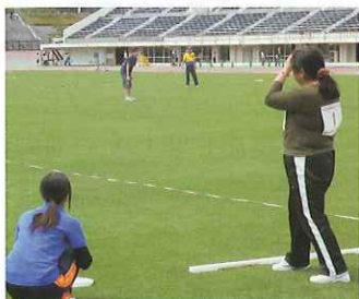
フライングディスク

5月19日に水泳・ボウリング・卓球、20日に陸上・アーチェリー・フライングディスクの6競技を実施し、延べ134人が参加しました。また強化練習会は各競技別に5回ずつ開催しました。