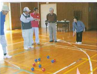
中部教室の様子 （ペタンク）

平成24年度 西部地区スポーツ教室 種目 卓球バレー 講師 鳥取県障がい者スポーツ協会指導員 日時 平成25年3月6日（水） 午後1時00分～2時30分 場所 日高津村農業青年センター