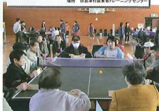
西部教室の様子 （卓球バレー）