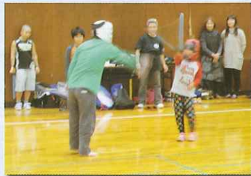
スポーツチャンバラ