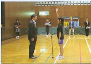
開会式・選手宣誓