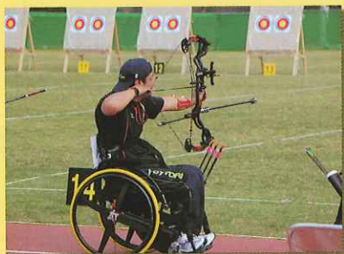
アーチェリー会場