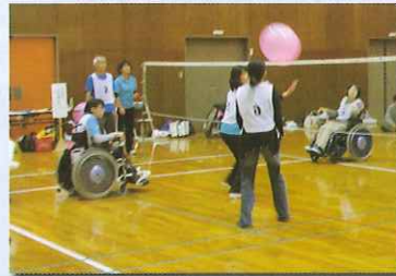
ふうせんバレーボール