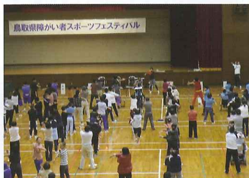
イベント開始前の準備体操