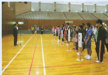
閉会式・福留会長挨拶