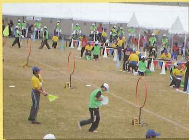
フライングディスク会場