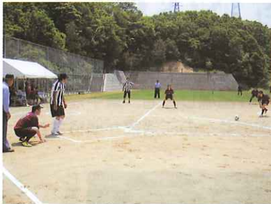
フットベースボール中国四国予選会 鳥取県-岡山県の一場面

試合結果：1回戦…鳥取県23-54広島市 高知県85-41愛媛県 岡山県71-37山口県 香川県90-20徳島県 交流戦…鳥取県23-80愛媛県 準決勝…高知県85-20広島市 岡山県64-53香川県 3位決定戦…香川県59-34広島市 決勝…高知県84-50岡山県