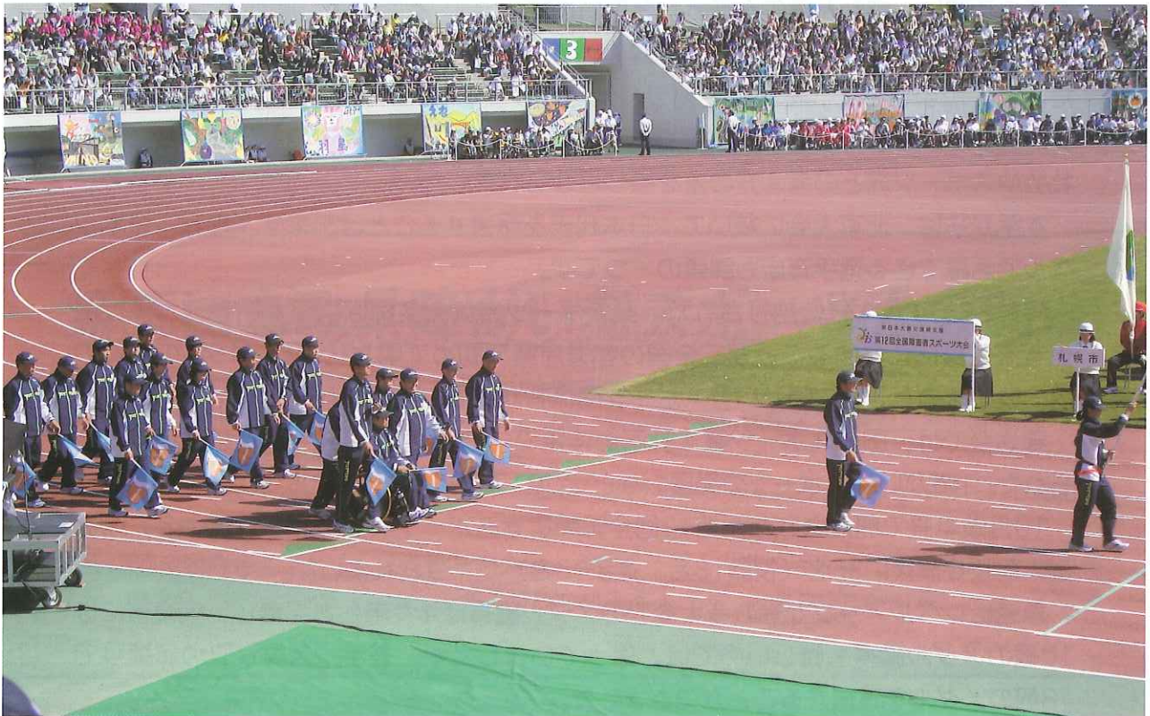
第12回全国障害者スポーツ大会開会式の鳥取県選手団入場行進