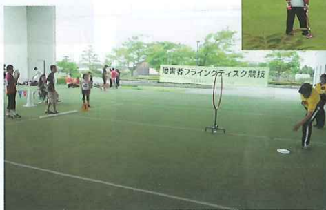
フライングディスク大会